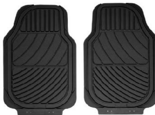
Tapete de borracha