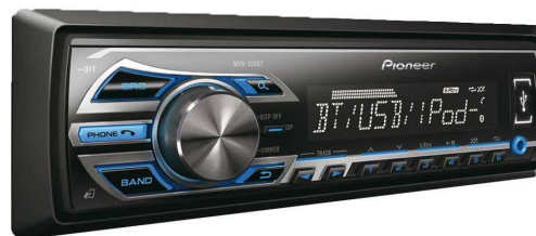
Pioneer MVH-X 178UI