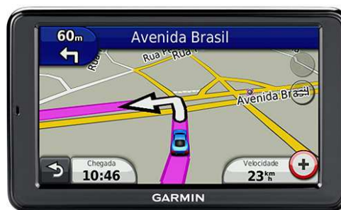
Gps Garmin Nüvi 2580TV