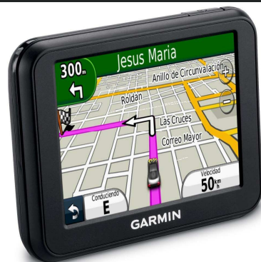
Gps Garmin Nüvi 30