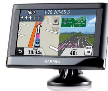
Gps Garmin Nüvi 42