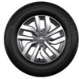
Rodas de liga leve 15"