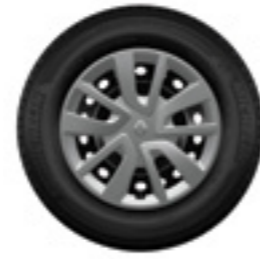
Calotas Magiceo 15"