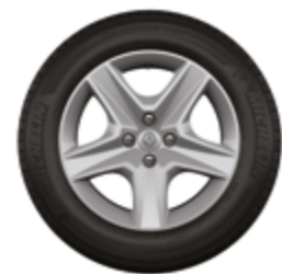
Rodas Flex Wheel Oasis 16"