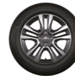
Rodas de liga leve Jogger 16" biton diamantadas